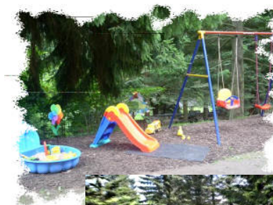
kl. Spielplatz im Grünen